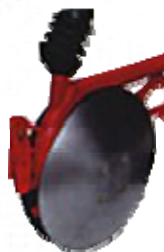
JEDNOSTRUKI DISK SLIKA 2