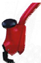
MOTIČICA SLIKA 1