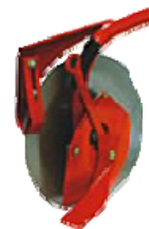
DVOSTRUKI DISK SLIKA 3