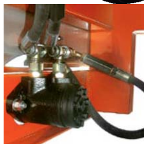
Pokretanje diskova preko hidro-motora