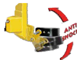
Mehanička zaštita u slučaju nailaska na prepreku